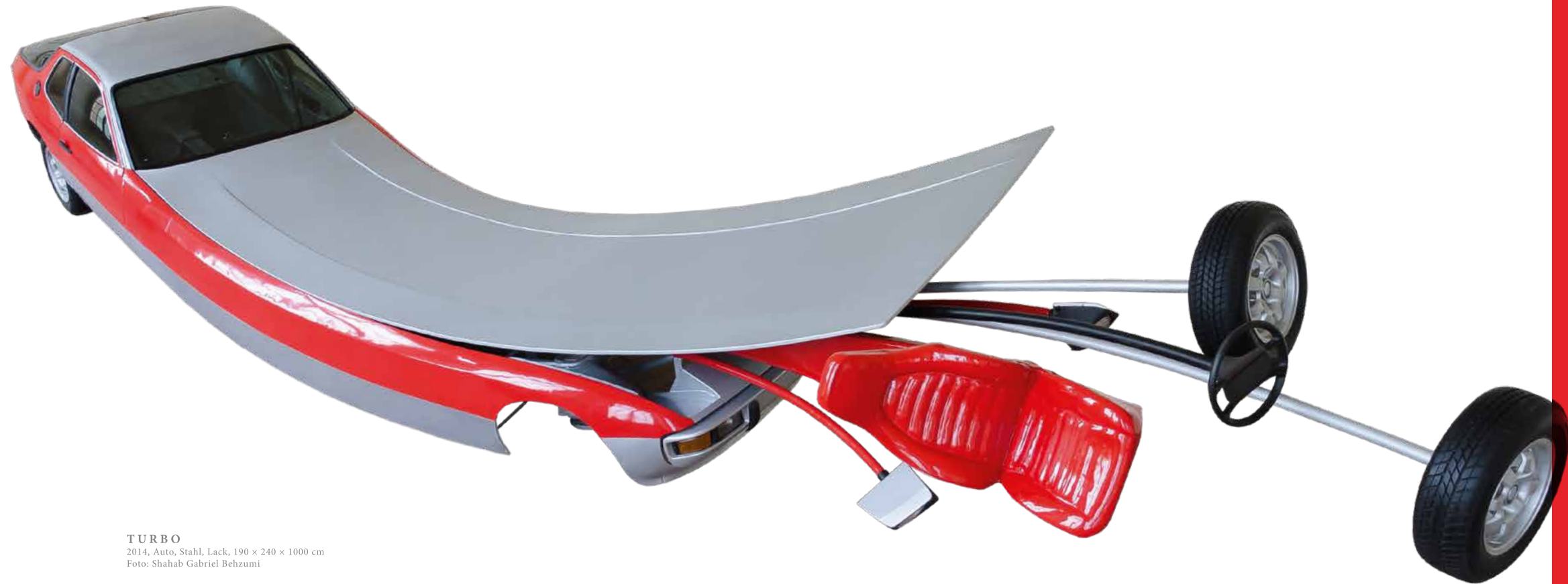
TURBO 2014, Auto, Stahl, Lack, 190 × 240 × 1000 cm

Formal nimmt Rohrer Anleihen aus der reichen Kunstgeschichte des Automobils. Bereits die um die Jahrhundertwende aufkommende Rennsportfotografie inspirierte Künstler zur malerischen Darstellung von Geschwindigkeit. Aufgewirbelter Staub und sogenannte „speed lines“, parallel zur Bewegungsrichtung verlaufende dünne Striche,