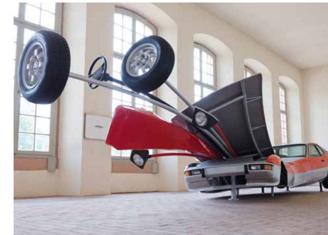
TURBO 2014, Auto, Stahl, Lack, 190 × 240 × 1000 cm, Installationsansicht, Orangerie Schloss Schwetzingen, 2014