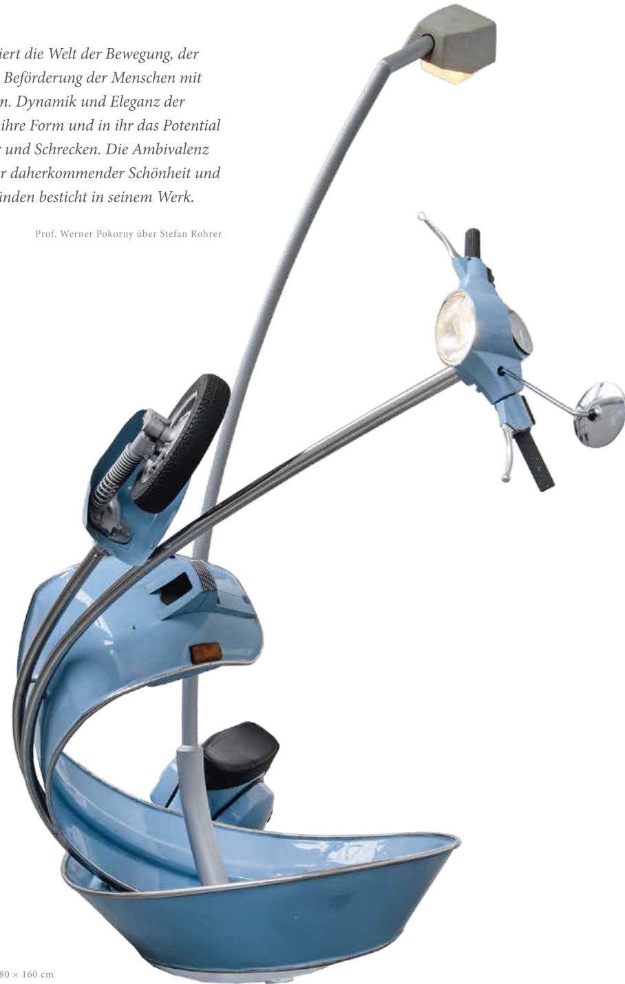
AZZURO CHIARO 2014, Motorroller, Stahl, Lack, 210 × 380 × 160 cm

Die farbenfrohen Skulpturen Stefan Rohrers sind faszinierend und unverwechselbar. Seine Materialien sind Autokarosserien, Motorroller und Modellautos. Teils elegant geschwungen, teils in wilden Wirbeln, greifen seine Rennwagen und Vespa-Roller in den Raum aus und vollführen atemberaubende Kunststücke. Farbenfroh, spielerisch leicht und unbekümmert kommen sie daher auf ihrer schnellen Berg- und Talfahrt, rasen durch Serpentina und Steilkurven. Zunächst ins schier Unendliche gedehnt, lösen sich die Formen schließlich auf und fliegen auf ihrer eigenen Bahn davon.